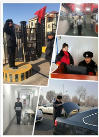
致节日坚守岗位的科技园物业人

寒风凛冽 有这么一群人 为了您和家人能安享春节 默默坚守岗位 任凭腿脚酸麻 忘却冻僵的双手和脸颊 仍旧站得笔直 守卫您的安全和家园 这个庄严的敬礼就是我最好的语言