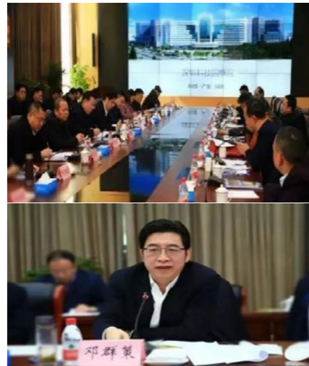
衡阳市市委副书记兼副市长（代理市长）邓群策发表重要讲话

衡阳市政府对深圳市园促会及企业代表组团入驻衡山科学城表示出极大热情与支持。市委副书记邓群策指出，衡阳市委市政府高度重视产业发展和实体经济发展，按照“产业引领、开发崛起”的要求，坚持“一张好的蓝图干到底”，热忱欢迎深圳市园促会及企业代表组团来衡投资，共同推动全市经济社会更好更快发展。要求双方解放思想、坚定信心，发挥各自长处，促成合作成功；要不拘一格、创新模式，做到双方互惠互利。市相关部门要齐心协力，优化环境，全力支持深圳市园促会及企业代表来衡投资、支持衡山科学城发展。